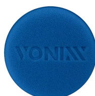
APLICADOR DE ESPUMA VONIXX