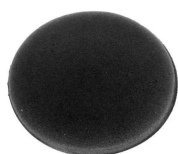
APLICADOR DE ESPUMA PRETO DETAILER